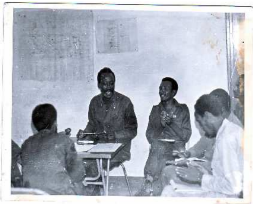
ሜ/ጄ. ረጋሣ ጅማ ባመራር ላይ፣ ተሰኔ 1970 ዓ.ም.

የዚህ መጽሃፍ ደራሲ የዋሉባቸውን የጦር ሜዳና የሥራ አካባቢዎች ከራሳቸው ገጠመኝ አኳያ በመጻፋቸው ምክንያት ሁሉንም ጀግናና ሁኔታ በዝርዝር ማውሳት እንደማይቻላቸው ግልጽ ነው። እናም በዚህ አጋጣሚ የምናነሳሳቸው ሌሎች ብዙ ብዙ ጀግኖቻችንም በተለያዩ ጦር ግምባሮች እንደነበሩ ማስታወስ የግድ ይላል። የዚህ አስተያየት ጸሃፊ የጦር ሜዳ ጋዜጠኛ ሆኖ በዘመተበት ወቅት ያወቃቸውን አንዳንድ ጀግኖች ዛሬም በኩራት ያስታውሳቸዋል።